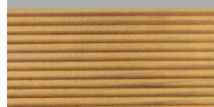
T0067 americký ořech